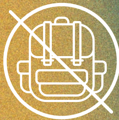
Große Taschen/ Rucksäcke (kleine Taschen bis DIN A4 erlaubt)