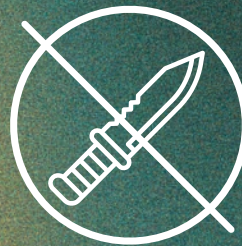
Waffen & gefährliche Gegenstände