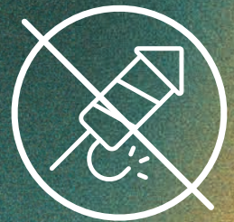
Pyrotechnik / Feuerwerk